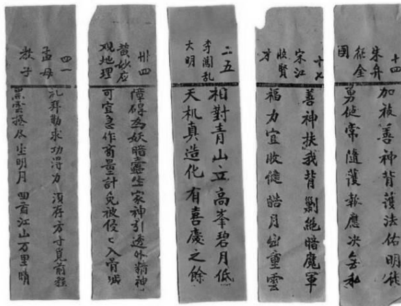
تصویر ۶. اشعاری از روستای سونی (Yuanyuan & Wushu, Appendix p. 438)

راست، تصویر سیاه و سفید از کتیبه اصلی با ۱۶ کاراکتر؛ چپ، کتیبه سنگی جایگزین با همان کاراکترها ۳