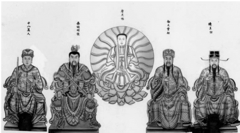
تصویر ۳. نقاشی دیواری در معبد خداوندگار جینگجو (Ibid., Appendix p. 437)