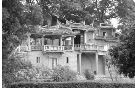
تصویر ۱. معبد چائوآن