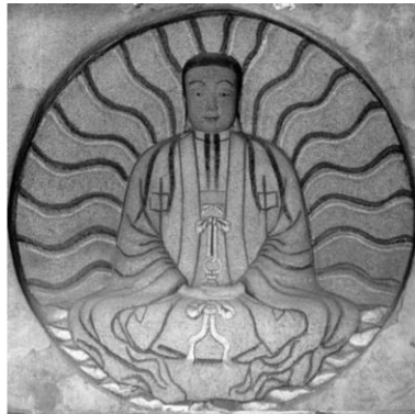
تصویر ۲. نقش برجسته مانی در چائوآن (Yuanyuan & Wushu, Appendix p. 436)