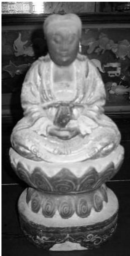
تصویر ۴. تندیس صورت قرمز مانی در روستای سونی ۲